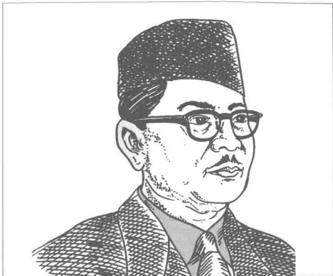
Tunku Abdul Rahman